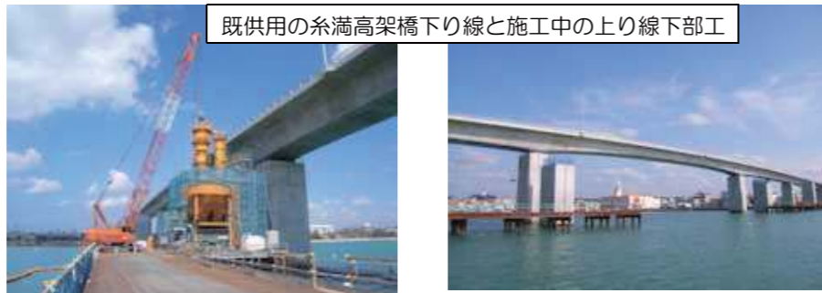
既供用の糸満高架橋下り線と施工中の上り線下部工

糸満道路も、平成23年3月に一部供用開始し交通混雑も緩和され、空港から南部地域へのアクセスも便利になりました。ところが時間帯によってはまだ、渋滞する箇所もあり、4車線全線開通が待ち遠しいものです。