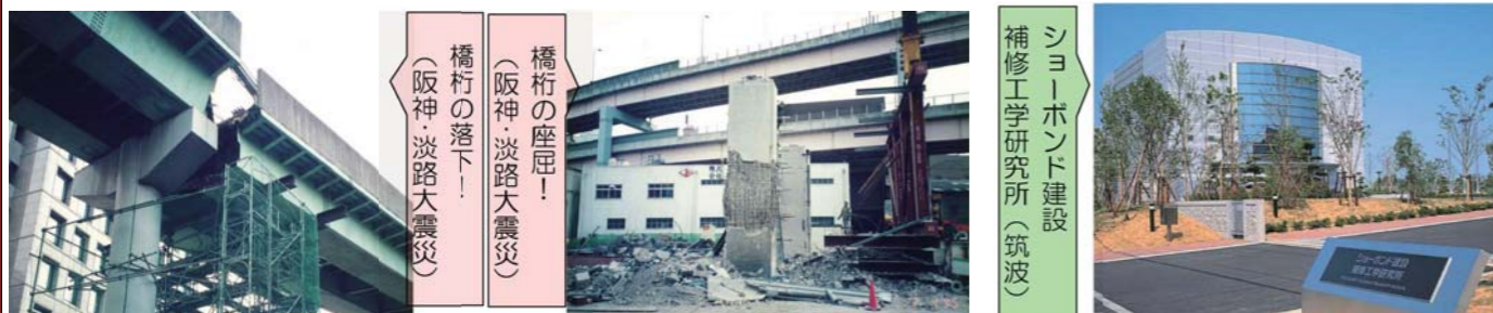
橋桁の座屈！ （阪神・淡路大震災） 橋桁の落下！ （阪神・淡路大震災）

弊社は、地震対策としての耐震補強や、構造物の長寿命化の技術を半世紀に渡り研究してきました。この技術力を活かし、微力ながら社会へ貢献していく所存です。