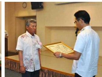
大濱支部長から賞状の授与!