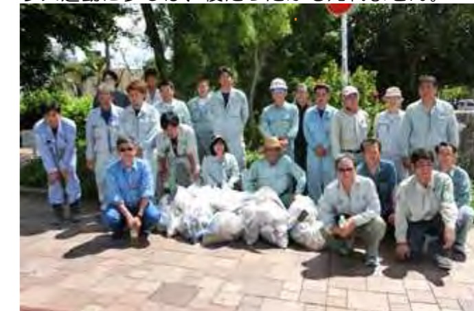
歩いてみると、いろいろ落ちているモンです!

9月16日(火)に、18社、21名の参加を得て第97回道路美化清掃活動を行いました。 当日は、集合場所の奥武山公園が樹木や草刈りの作業日に当たり、いつもの駐車場が使えないとのことで、少し遠い第二駐車場となりました。 天気は、曇りでしたが蒸し暑く、普段より多く歩いて汗だくの作業となりました。1キロヘルス運動に少しは、役だったかも知れません。