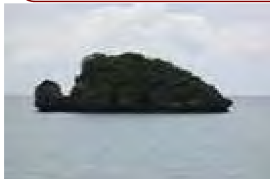
通称ヤンパーランジ カメにみえるかな?