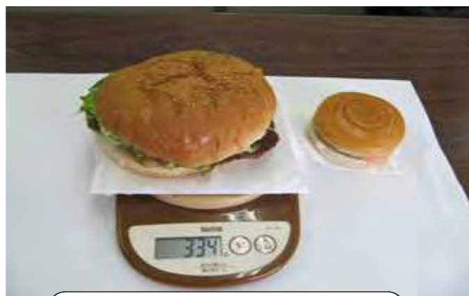
見よこの大きさ! 右は普通のバーガー

落ちそうなくらいはさんであり、出来立てを食べられるので、とってもジューシーでした。あまりにも大きいので、お店の方にカットしてもらって皆で分けて食べました。 今年の夏はいつもより残暑が厳しいように感じられます。夏の疲労回復に手軽に食べられる「ジャンボハンバーガー」お昼ご飯にお勧めですよ~ 今回も当営業所のカチマイ事務員が金武町からお伝えしました。