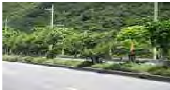
ソテツ並木 黄色く見えるのが雄花!