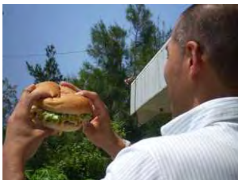
どこからかぶり付くか検討中!

所長にストップをかけて大きさを測ってみると、なんと、おもさ334グラム、大きさ15cmと超特大サイズ。通常の3倍の大きさ(某コンビニのハンバーガーと比較)お値段も300円とこれまたお財布にやさしい。 キャンプハンセンのゲート近くで「ジャンボハンバーガー」の旗が立っている店で販売とのこと、私も早速購入してきました。