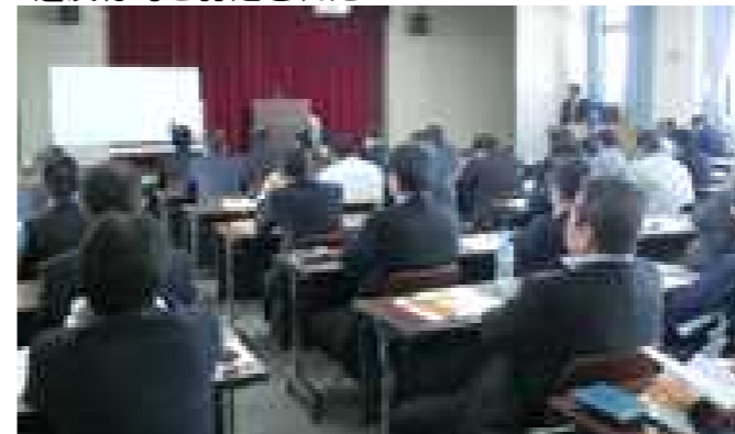
今後の取組に役立てようと熱心に聴講する参加者