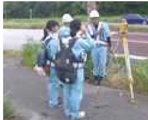
測量機器に興味津々の様子！

やっていて、とてもかっこよかったです。また、わきあいあいとして、とても楽しそうだと思います」 名護高校1年〇〇