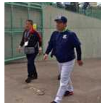
午前中の練習を終えたヤクルト真中監督

良さです♪♪♪ 開幕までオープン戦とセットで、沖縄の春はサクラだけじゃない、プロ野球も一足先に始まります！