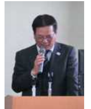
開会挨拶！与那嶺支部長