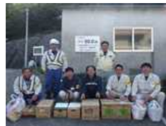
グランドゴルフ大会で 商品提供