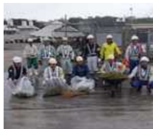
清掃・草刈り作業