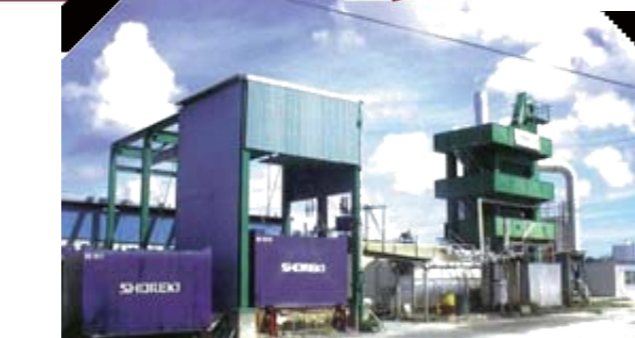
西表島のプラント

私ども共和産業(株)は、1969年に設立しました。1973年に、宮古空港ジェット化工事のため、アスファルトプラントを設立しました。当時、先島地区の舗装工事といえば、乳剤舗装のみで、アスファルト合材による本格的な舗装は先島地区に於いては当社が最初でした。当初は、舗装技術や品質管理などで未熟な面があったことから、本土の建設会社と技術提携を結び技術員を受け入れ、舗装技術など色々な技術を学び習得しました。その技術を活かし、宮古空港や石垣空港の舗装工事を行いました。その後、アスファルトプラントの大型化を行い1977年には、旧プラントを当時島の東部と西部を結ぶ県道整備が進められていた西表島に移設し、県道や町道、農道などすべての道路の舗装を担いました。創業間もない時期に、当社を支え、又、宮古島、西表島など先島の道造りを支えその発展に大いに貢献したアスファルトプラントです。現在も宮古島、西表島で活躍を続けています。