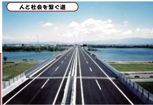
人と社会を繋ぐ道

舗装工事や土木工事だけでなく、工場や倉庫などの建築工事、商店街や集合住宅のリニューアル工事など、フェンスの補修から汚染土壌の浄化まで、どんなお困りごとでもお気軽にご相談ください。