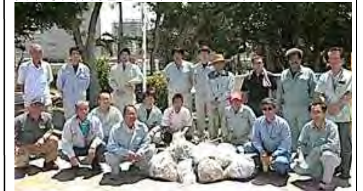
拾い集めたゴミ袋を前に記念撮影!

第 105 回ボランティア活動を 5 月 19 日(火) 15 社 18 名の参加で実施しました。 好天に恵まれ、皆で道路清掃に清々しい汗を流し無事終了しました。この日、奄美では梅雨入りとなりましたが、沖縄は遅れているようです。(翌 20 日に沖縄も梅雨入りしました。)小満芒種(スーマンボージュ)でじめじめした日が続きます。食中毒、体調管理に気を付けましょう。