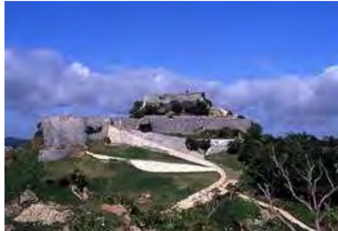
世界遺産群の一つ、勝連城跡!

会員の皆様こんにちは。 弊社が所在するうるま市は、平成 17 年 4 月 1 日に隣接する具志川市、石川市、勝連町、与那城町の 2 市 2 町が合併して誕生し、今年で合併 10 周年を迎えました。 本市は、県内中部地域唯一の有人離島である津堅島を含む 8 つの島々や海中道路、海洋レジャーに適した多くの海浜を有するなど、美しい風景と豊かな自然環境に恵まれた風光明媚なまちです。 また、世界遺産群の一つである勝連城跡をはじめ、貴重な歴史遺産やエイサー、闘牛などの伝統