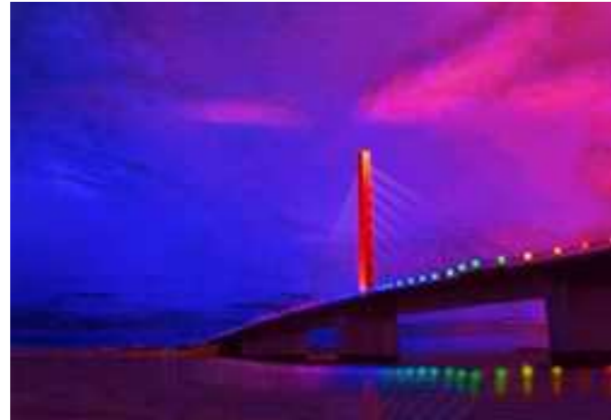
美しくライトアップされた海中道路!

文化が若い世代にも受け継がれ、市の観光産業としても注目されています。うるま市は合併 10 周年の節目を迎え、去った 5 月 9 日(土)、8 年ぶりに行われた「全国闘牛サミット」をはじめ、今後様々な事業を予定しており、活気あるうるま市を全国に広めるべく行政を先頭に市民一体となったイベントが企画されております。 弊社もうるま市の一員として、市民のためにより良いインフラ整備を心掛け、地元うるま市の発展に貢献できるよう精進してまいりたいと思っております。