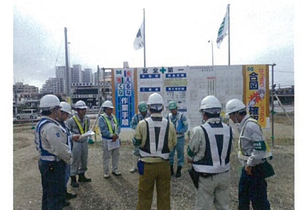
パトロール実施後の現場講評