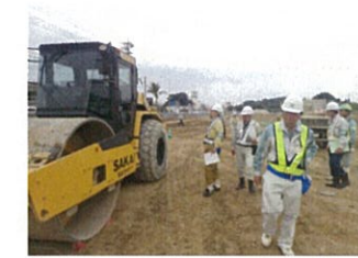
舗装工事実施状況

の啓蒙に多いに役立っており今後も安全パトロールを継続して実施し、各工事現場が「無事故・無災害」で竣工することを祈念するとの総評で報告を締めました。