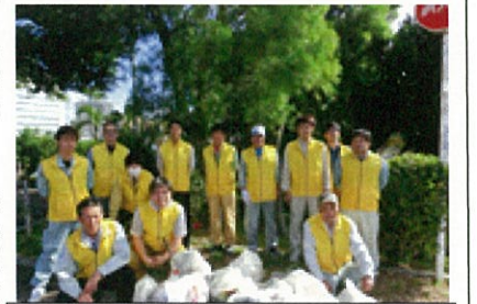
今年最後の美化活動でハイポーズ

12月20日(火)に10社13名の参加の下、今年最後の道路美化清掃活動を実施しました。 きれいになった道を歩く人たちが、清々しい気持ちで、もうすぐやってくるクリスマスやお正月を迎えられたらと思います。 参加者全員が、事故もなく、1年間、道路美化・清掃活動を実施できたのも会員各位のご理解、ご協力のおかげです。ありがとうございました