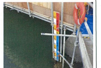
橋梁補修工事実施状況