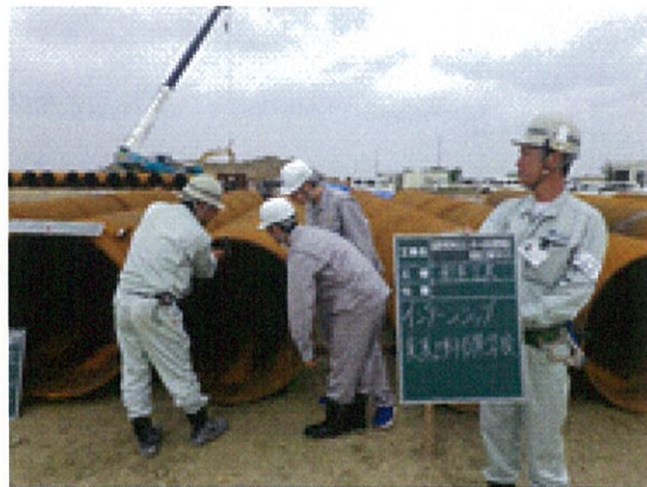
高校生! 貴重な現場体験 一言も聞き逃さないぞ〜

②現場での清掃の仕方・周りに気を配る大切さを知ったとの感想から、高校生が業界に対する現実を実感できたのではないかと思います。 我が社では、今後も建設産業人材確保・育成のインターンシップ制度等、様々な制度を導入し、「人々が安心して暮らせる社会を創る」仲間を育てる環境を創っていきたく思います。 本年もどうぞ宜しくお願いします。