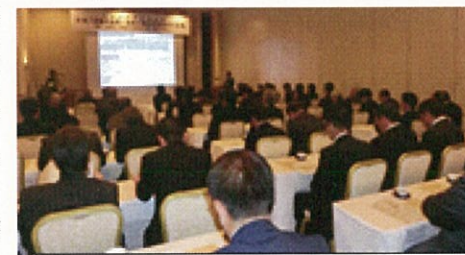
講演会に聴き入る支部会員の皆さん