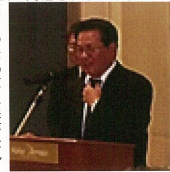
開会挨拶する与那嶺支部長