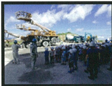
生徒の前で動くカッコイイ重機