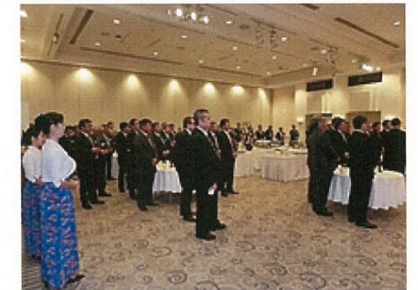
多くの関係者が集い賑わう会場