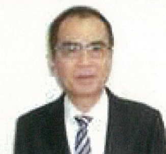
第一講義の安里建設工務室長補佐