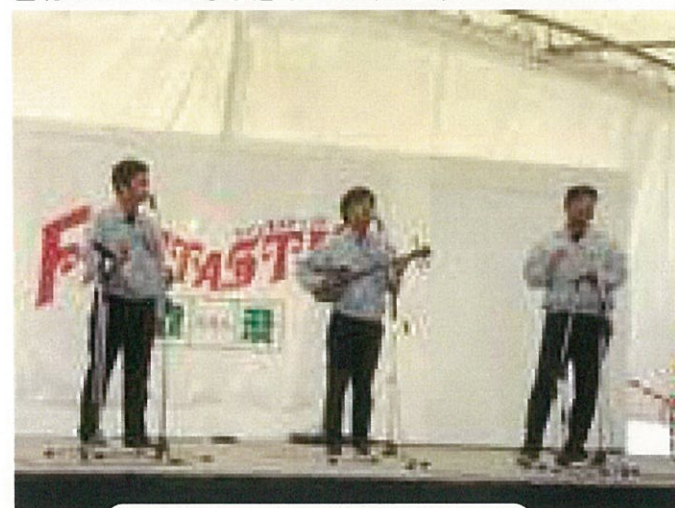
ステージで熱唱する『チームP2』！

に感謝し、沖縄市社会福祉協議会および関係者の皆様にはこの場を借りてお礼を申し上げます。