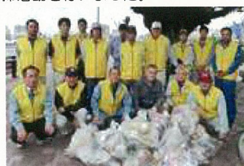
皆さんで力を合わせゴミを集めました！

それでも、これからは、汗だくな暑さも無くなり気持ちよく作業が出来るものと思います。