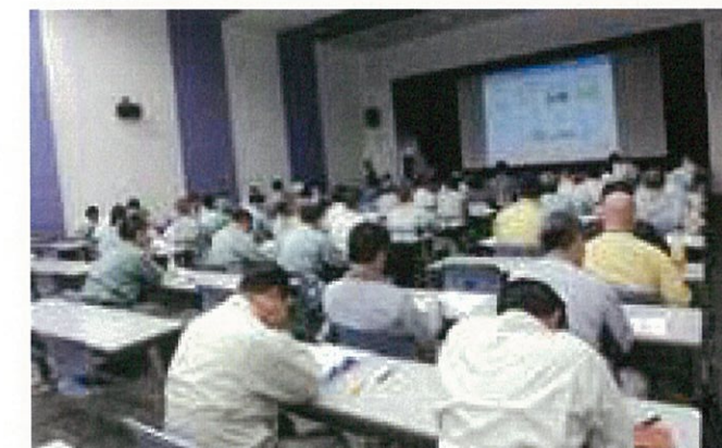
会場では多数の受講者が、講師の言葉に聞き入っていた！