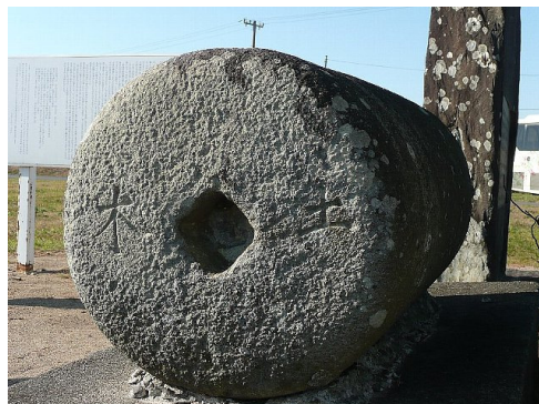
[石製ローラ 野蒜築港跡 2009.11]

議 事 ①3.11大震災 道建協対応概況報告 ②震災復旧工事アンケート結果のまとめ ③防災協定の運用についての検討