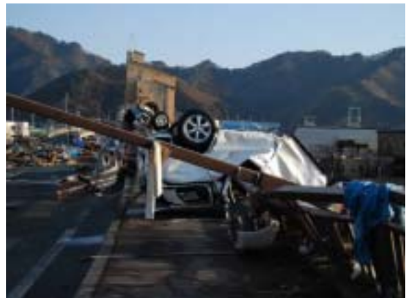
被災直後の矢の浦橋