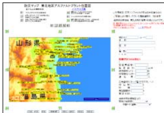
防災マップ URL http://www.jrca-chapter.net/tohoku55/index.htm