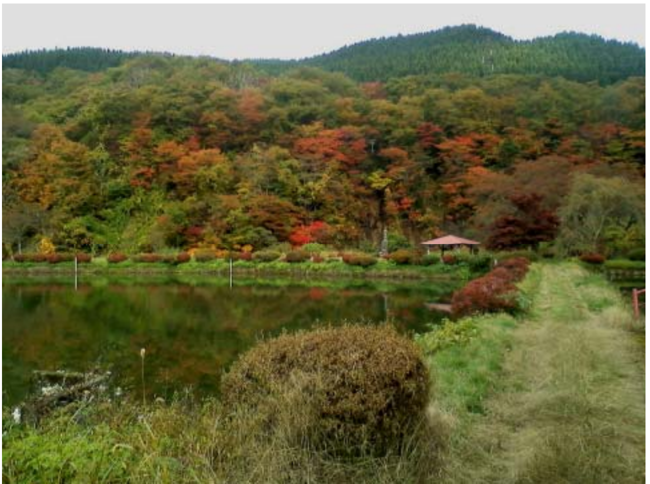
(秋田県上小阿仁村 2012.10)