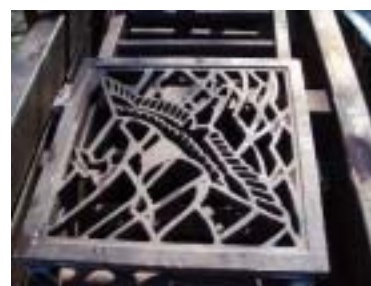
被災した矢の浦橋のレリーフ