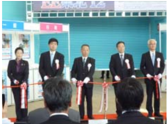
オープニングセレモニー 中央 早稲田支部長