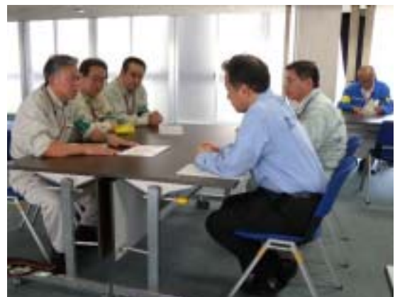
リエゾン派遣(整備局)