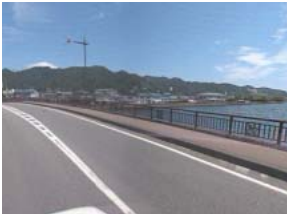
被災前の矢の浦橋