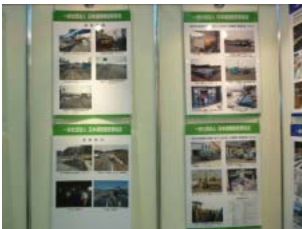
道建協のパネル展示