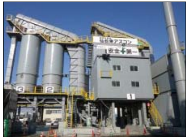
【共同企業体 仙台東アスコン(新設)】

今、私ができる復興とは、復興需要に全力で取り組む職員の健康と安全を考え、又当工場を支えてくれる沢山の協力会社方々との輪を大切に、被災者と被災地域の為に社会基盤の再生に貢献できる工場づくりを実践することだと考えます。