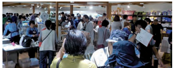
▲ 道の駅 物産販売所の賑わい

伊豆半島の玄関口 道の駅「伊豆ゲートウェイ函南」は伊豆の観光情報・道路情報を提供すると共に、伊豆の土産物を取り揃えた物産販売所は、多くの観光客が利用しています。また、新たな小惑星「函南」を発見した月光天文台は、全天周デジタルプラネタリウムを完備し、宇宙の神秘を体感できます。