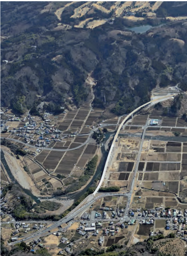
▲ 伊豆縦貫自動車道 天城北道路

伊豆縦貫自動車道の伊豆市区間である天城北道路は、整備が進み平成30年度中の供用が予定され、東名・新東名高速道路から伊豆市まで走行性の高い道路で結ばれます。また、函南町の市街地を通過する伊豆縦貫自動車道は、伊豆半島を訪れる観光交通の玄関口として、伊豆観光の再生に寄与しています。