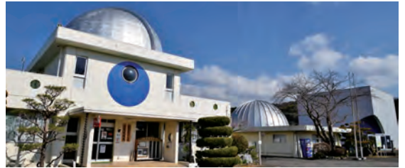
▲ 月光天文台とプラネタリウム

伊豆縦貫自動車道の伊豆市区間である天城北道路は、整備が進み平成30年度中の供用が予定され、東名・新東名高速道路から伊豆市まで走行性の高い道路で結ばれます。また、函南町の市街地を通過する伊豆縦貫自動車道は、伊豆半島を訪れる観光交通の玄関口として、伊豆観光の再生に寄与しています。