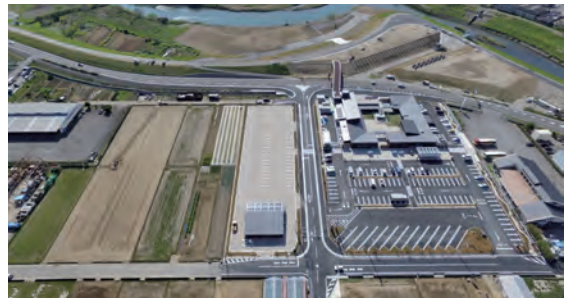
▲ 道の駅「伊豆ゲートウェイ函南」・川の駅